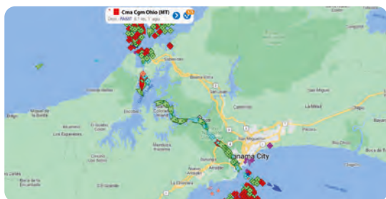
Containeren er på vej igennem Panama Kanalen.

Så med Apple's Finder-app på telefonen og rederiets web-baserede ship-tracker, kunne jeg følge transporten rimelig nøjagtigt og da jeg selv ankom til Chile i starten af december, så vågnede min telefon med et lille ping om at nu havde den fundet min mc og bagage i havneområdet i San Antonio.