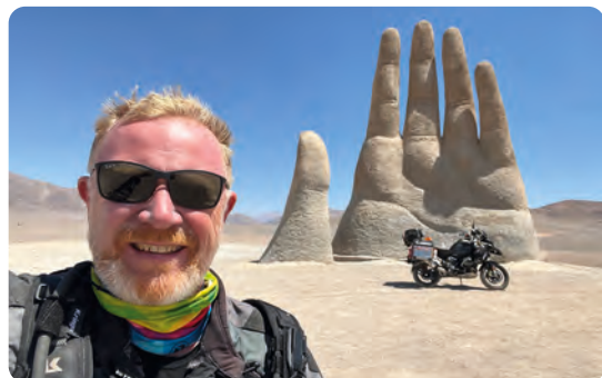
Selfie ved Mano del Desierto i det nordlige Chile.

Så nu manglede der kun et enkelt kontinent efter at have kørt motorcykel i 46 lande på de første 5 kon-