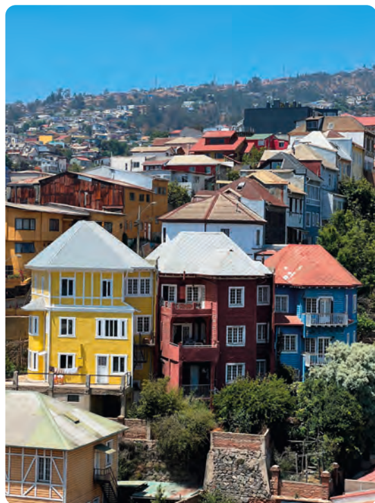
Valparaiso op mod de mange høje som byen er bygget på.

I næste artikel fortæller jeg lidt mere om starten på rejsen mod stjerner, ørken, højdemeter og vulkaner og jordkælv – med udlevering af motorcyklen, doku-