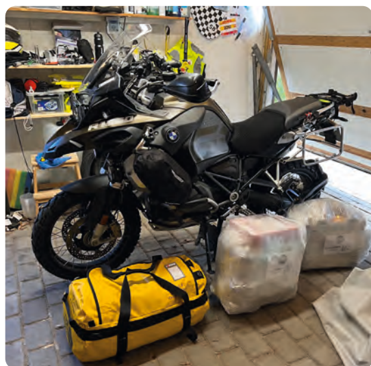
Mit kæreste eje klar til rejsen til Sydamerika.

Nu kom så dagen hvor en i min optik alt for ung polsk chauffør i en polsk varevogn skulle afhente mit