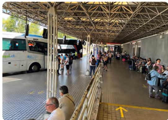
Chile's public transport er store busser – tog linierne er nedlagt

Og denne lille forhindring var bestemt ikke den eneste i mine 3 måneder – men trods alt til at håndtere i 26 gr varme og i godt selskab. Jeg havde skrevet sammen med en herlig jysk tømrer som kom til Chile godt en måned tidligere end mig med sin motorcykel, og tog med de lokale "tog" – hele Chile's public transport er store busser, toglinierne er lukket for mange år siden – ud til kysten i Valparaiso for at møde ham og tage de næste dage på et pragtfuldt B&B, inden selve eventyret kunne begynde.