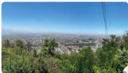
Santiago de Chile er Chile's hovedstad set fra Cerro San Cristobal højen.

Og denne lille forhindring var bestemt ikke den eneste i mine 3 måneder – men trods alt til at håndtere i 26 gr varme og i godt selskab. Jeg havde skrevet sammen med en herlig jysk tømrer som kom til Chile godt en måned tidligere end mig med sin motorcykel, og tog med de lokale "tog" – hele Chile's public transport er store busser, toglinierne er lukket for mange år siden – ud til kysten i Valparaiso for at møde ham og tage de næste dage på et pragtfuldt B&B, inden selve eventyret kunne begynde.