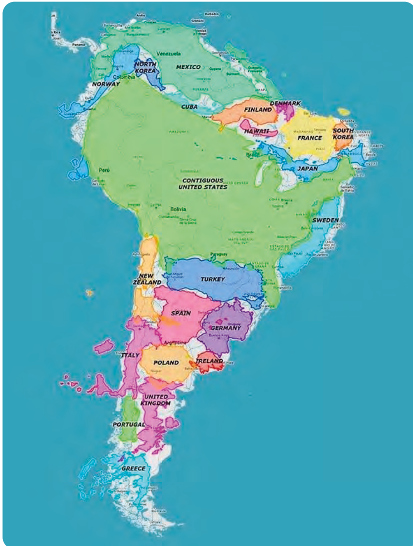
Sydamerika er stort.

Denne artikelserie bliver bragt i de 4 udgaver af KI i 2024 og dækker planlægning, forberedelser, dokumenter og transport, sikkerhed, rejsen og oplevelserne – og selvfølgelig mine erfaringer og læringer, som andre måske kan tage med videre.