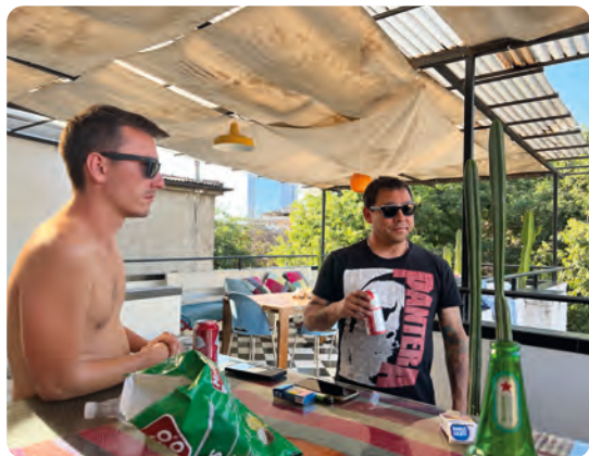
Hygge, løgnehistorier og øl på Hostel Casa Matte.