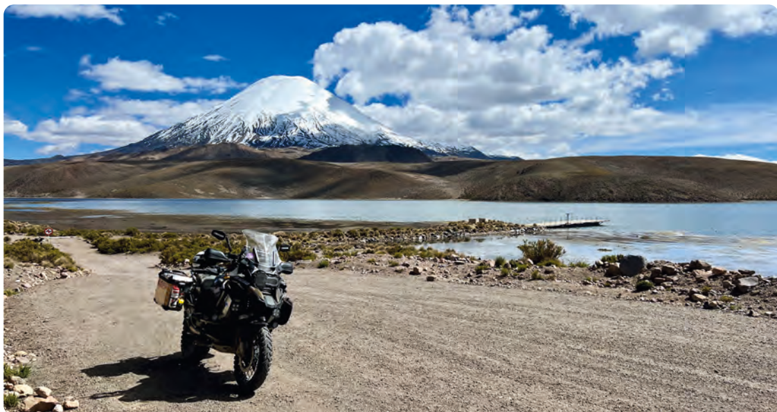
Coverbillede – På kanten mellem Chile og Bolivia i 4.600 m.o.h.

I 1983 fyldte jeg 18 år og tog kørekort til bil og startede også med MC-kortet, men løb tør for penge og tid pga. andre meget vigtigere ting, som venner, piger osv. Men efter mange ferier i Sydeuropa i bil med hele familien, hvor jeg dagligt så mænd med brede smil på deres motorcykler i sving og bjerge – så var jeg solgt og som 36-årig blev jeg motorcyklist – og har ikke vendt den interesse ryggen siden.