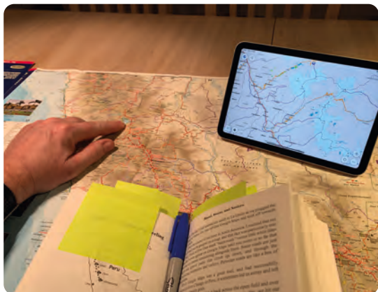
Planlægning på spisebordet hjemme år før rejsen.

udenlandske rejsende på tur – høste erfaringer om hvordan det er at rejse i de lande, hvad der skal tages højde for, hvordan håndteres papirer og penge, sikkerhed, adgang til brændstof og overnatninger, forsikring af mig og motorcyklen, forståelse for mulige sygdomme og have sit beredskab klar til at kunne reparere mig selv og min motorcykel. Her gik jeg f.eks. all-in og hos en rigtig god mc-kammerat der er ortopædkirurg og faktisk har lappet mig sammen et par gange, fik jeg et kursus i at sy-selv, skulle jeg være uheldig undervejs.